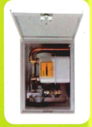
Coffret de rénovation