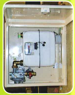
Coffret S2300 16m³/21mbar